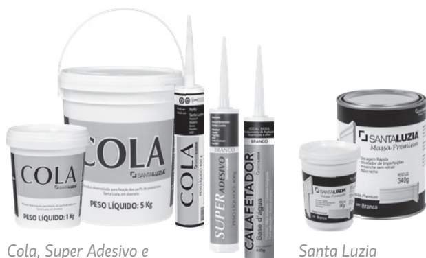
Cola, Super Adesivo e Calafetador Santa Luzia