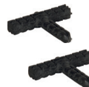
Bucha T Santa Luzia