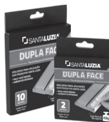
Fita Dupla Face Santa Luzia